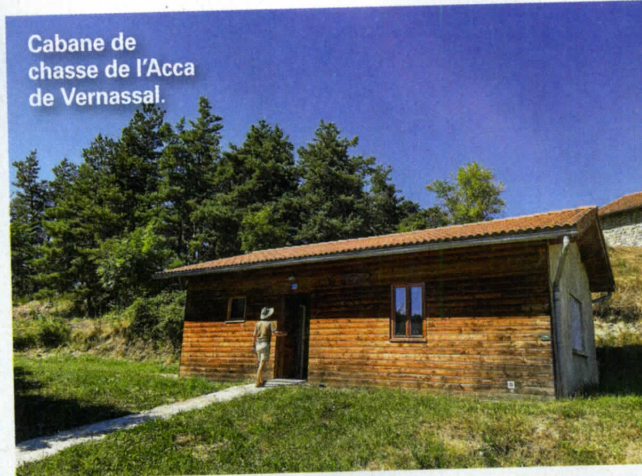
Cabane de chasse de l'Acca de Vernassal.

Très engagée dans la sauvegarde du petit gibier, l'association comporte 232 membres. Elle mène de nombreuses opérations de terrain dont le financement et la pose de nichoirs à canards, et conduit des expérimentations telles que l'opération Faisans d'un jour. Elle a obtenu notamment le report de la date d'ouverture du lièvre et œuvre pour développer et gérer durablement la petite faune sauvage dans les Acca. C'est aussi une force de proposition et d'action pour préserver les habitats en relation avec les agriculteurs, et effectuer des repeuplements à l'aide de bonnes souches.