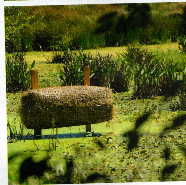
La mise en place de paniers de ponte favorise, là aussi, la reproduction des colverts.

La Chaise-Dieu, la Margeride ou encore le mont Mézenc. Les adeptes de plume chassent aussi activement la bécassine sur les zones humides de la commune dont l'une a été spécialement aménagée à cet effet. Ou bien la palombe, aux formes en plaine, et surtout le soir au passage ou à l'affût au bois, au dortoir.